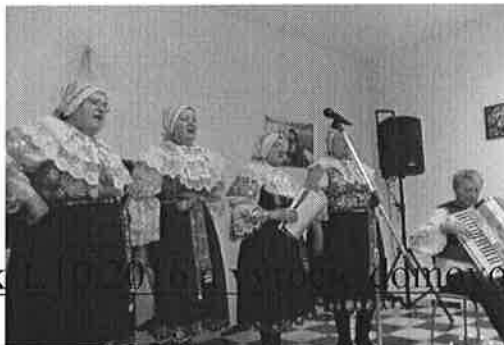
Slávnostné otvorenie prístavby k... ...ome...ov